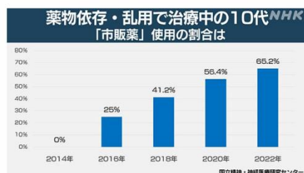
「10代における『主たる薬物』の推移」