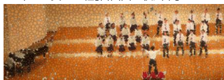
<3年・金賞>C組[自由曲：証]