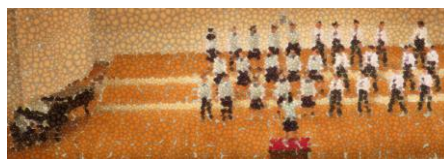
<1年・金賞>D組[自由曲：怪獣のパラード]

たましん RISURU ホールにて合唱コンクールをおこないました。日頃の練習の成果を発揮し、どのクラスもとても素晴らしい合唱でした。多くの保護者・来賓の皆様にご鑑賞いただきありがとうございました。