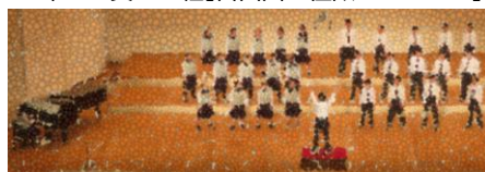
<2年・金賞>A組[自由曲：夜汽車]