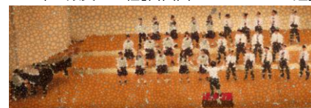
<2年・銀賞>B組[自由曲：青葉の歌]