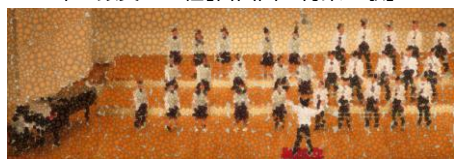
<3年・銀賞>B組[自由曲：はじまり]