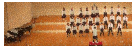
<1年・銀賞>C組[自由曲：HEIWAの鐘]