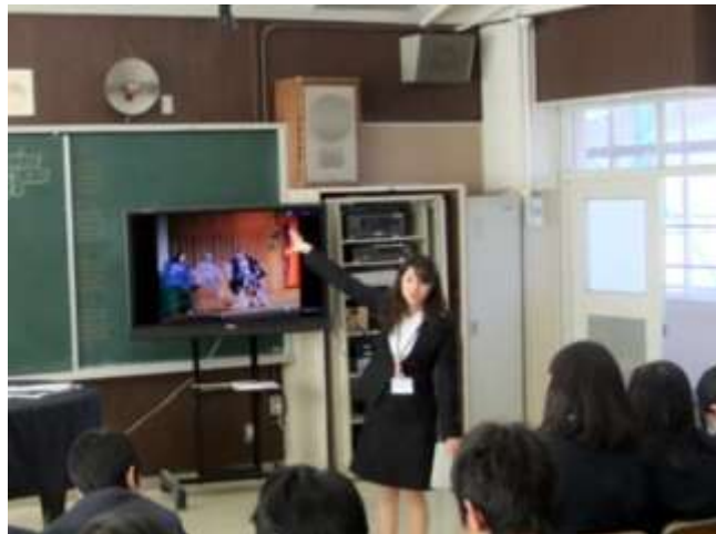
音楽科では歌舞伎の魅力について考える