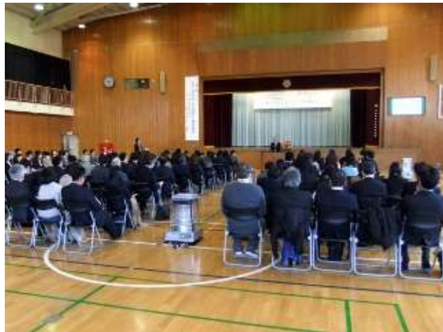
研究発表での指導講評