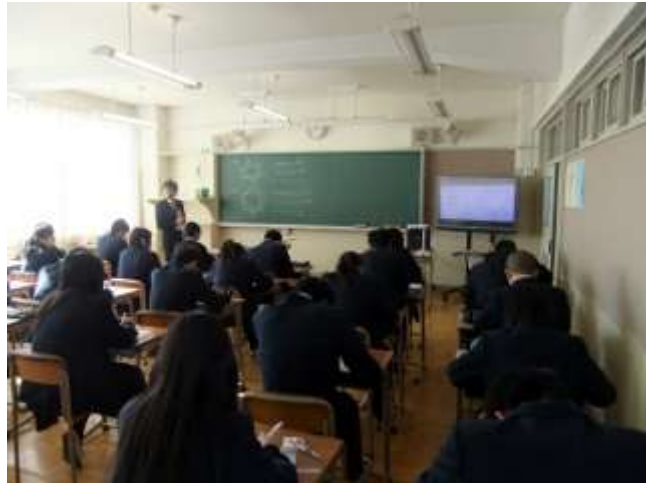
習熟度別少人数での数学