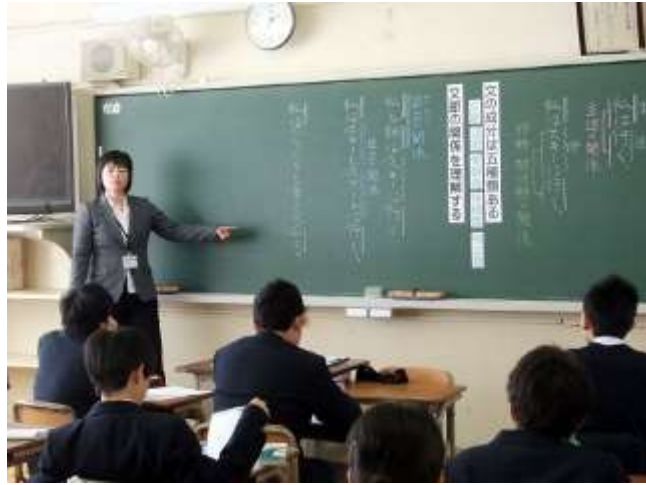
国語科の習熟度別少人数での授業