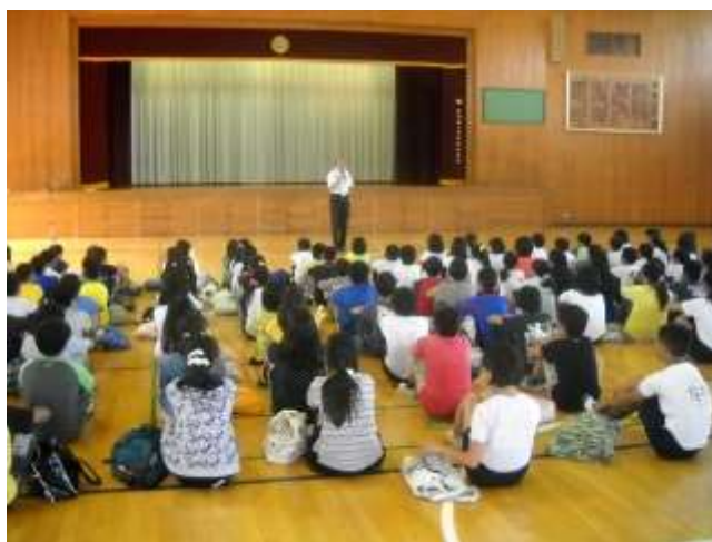
校長先生からの話

体験授業を通して、中学校生活に興味を持ち、来年の4月には夢と希望をもって入学してきてください。