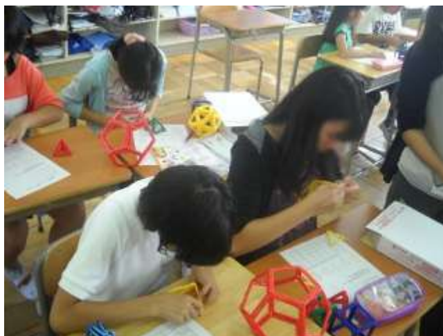
数学では立体を作りました。