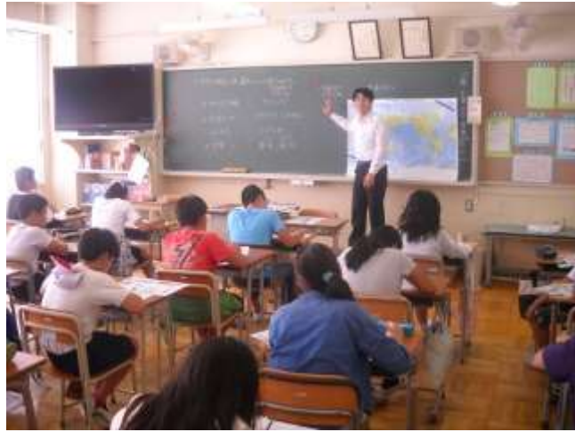
社会では世界の四大文明について学びました