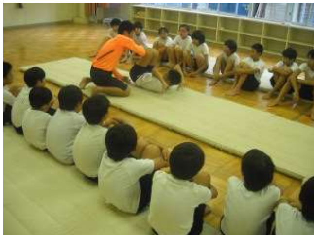
体育でのマット運動