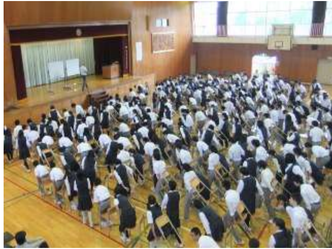
不破先生の計らいで全員が前に移動