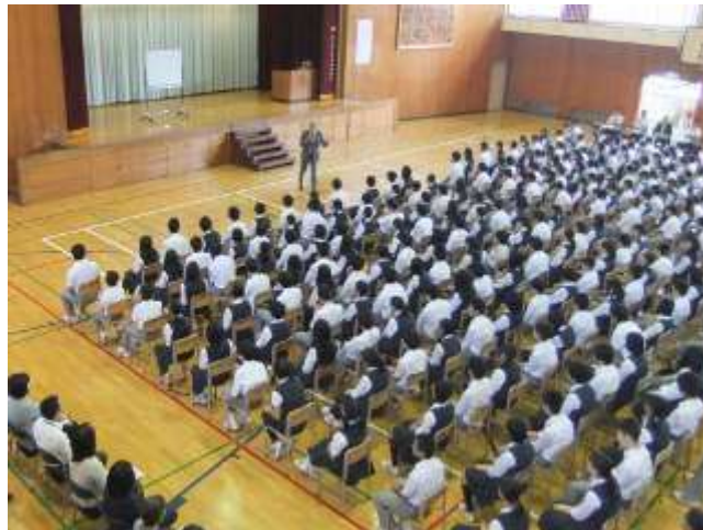
体育館にて、講演会開始

特に、夢をかなえるための『6つの力』は、参加者全員の記憶にしっかりと残った言葉でした。