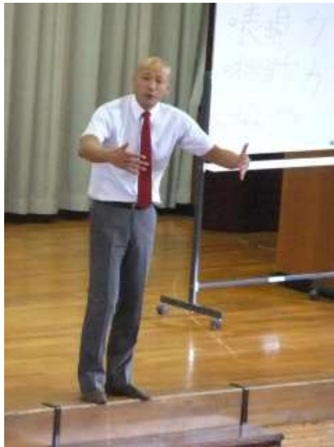
身振り手振りで、話を盛り上げていただきました