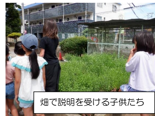
畑で説明を受ける子供たち