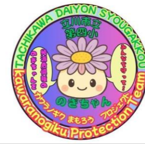
マスコット のぎちゃん