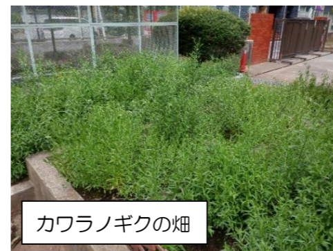
カワラノギクの畑

そして、そのカワラノギクとの出会いに感銘を受けた子供たちは、自分たちでカワラノギクを守っていこうという活動を始めたのです。まず、全校朝会で呼びかけ、一緒に活動してくれる人を集めました。すると20名くらいの子供たちが自主的に名乗り出ました。そして、そのプロジェクトを発信した子供たちはお世話の仕方について自分たちで説明会を開きました。そしてこの猛暑の夏も子供たちの手によりカワラノギクの世話が続けられているのです。秋には紫色のきれいな花が咲きます。校門のすぐそばですので、どうぞご覧ください。こんな子供たちの想いが形となっていくよう、私たち教員はサポートしていきたいと思っています。