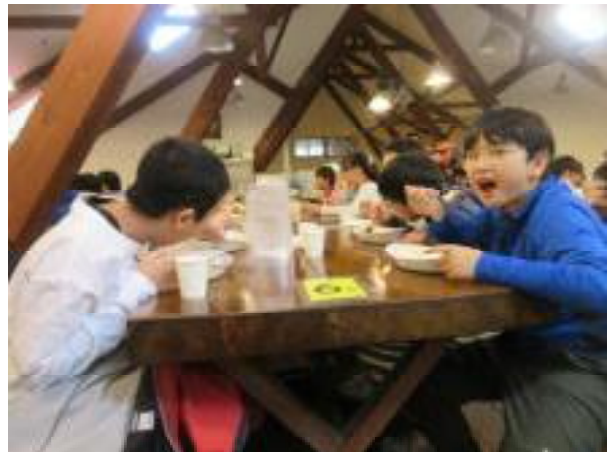
赤沼にゴールして、光徳牧場に移動。お昼はカレーです。アイスもつけました。