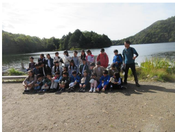
出発前、元気なうちに湯ノ湖畔でパチリ。クラス写真。